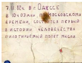
Іл. 1. Записка-атрибут.