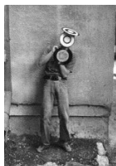
Фото 5. «Щит Давида» (1983).