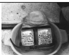
Фото 10. Об'єкт-атрибут перформансу «Розвідка художніх копалин» (1987).