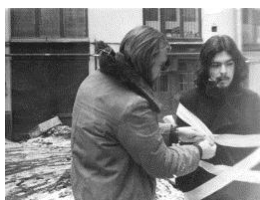
Фото 1. «Хрестик-Нулик». С. Ануфрієв, В. Наумець.